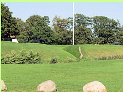
Hals skanse ved indløbet af Limfjorden er Danmarks bedst bevarede enkeltskanse fra renæssancen. I 1650'erne indtog svenskerne skansen flere gange, men i 1811-1812 forsøgte engelske flådestyrker flere gange forgæves at erobre skansen.