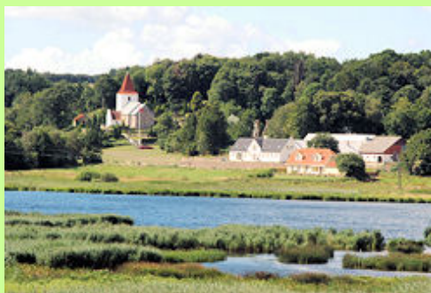
Snesevis af nordjyske landsbyer er af typen randlandsbyer, liggende på randen af det høje land med den dyrkede jord ovenfor byen. Her Gravlev med den genskabte Gravlev sø på de tidligere høsletenge i forgrunden. En "helligkilde" bag kirken har været starten til beboelse på stedet.

Kirken fik - som modydelse for at sikre "kontakten til guddommen" - ligeledes ret til at udskrive skat - kaldet tiende.