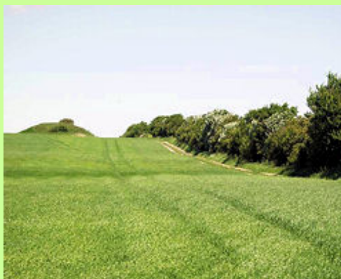
Et træbevokset jorddige i landskabet - umiddelbart såre almindeligt. Diget er hovedgårdsdiget, der omkransede jorden under hovedgården Skovsgård sydøst for Hobro. Det har overlevet i 5-600 år, men kan nemt fjernes på en dag med en gummiged. Diger er dog beskyttede af lovgivningen. Gravhøjen er fra bronzealderen.

Eksempel på privilegier knyttet til fiskeri er ålekisten ved udløbet fra Glenstrup Sø . Her har man siden 1200 tallet ledt alt åens vand gennem en netfælde, der opsamlede ål på vandring ud fra søen. Ålekisten findes stadig, om end i mere nutidig udformning. Kisten drives af et lav med 8 parthavere, alle bosiddende i Glenstrup Sogn. Ørredgården ved Vegger er et andet eksempel på et gammelt fiskeriprivilegium, hvis fysiske rester stadig kan opleves i landskabet.