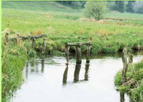
Gennem århundreder havde gården Veggergaard en eneret til at afspærre Sønderup Å og opfiske laks, havørred og ål. For retten betaltes en afgift til kronen. Resterne af ørredgården kan stadig ses i åen syd for landevejen ved Vegger. Den var i drift også efter anden verdenskrig. Rettigheden bortfaldt i 1971. Se foto fra 1934.