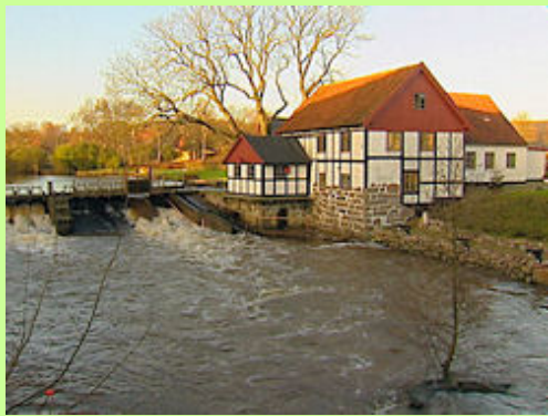
Sæby Vandmølle er anlagt som kongelig ejendom i 1640, men blev hurtigt afhændet til ejeren af Sæbygård. Møllen gav gode indtægter både fra mølledriften og fra retten til at opkræve bropenge. Den idylliske bindingsvæksbygning er fra 1710.

Ved at følge gravhøjene kan man ofte se, hvor de gamle vejforbindelser har løbet. Gravhøjene var datidens statussymboler, stammens eller slægtens signaler om magt og offervilje, som skulle opleves af andre. Når gravhøjene ligger i rækker er det ikke tilfældigt, men simpelthen fordi de lå - langs vejen.