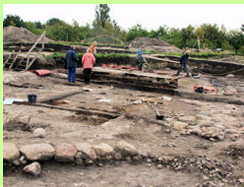
Aalborg Øst gemmer på adskillige jernalderlandsbyer, der har flyttet rundt i området. Særlige landskabsforhold har muliggjort arkæologiske sensationer, f.eks. en velbevaret landsby begravet i flyvesand ved Gigantium og længere mod nordøst en landsby med en nedbrændt stald (ved personerne på billedet), hvor den kalkrige jord har bevaret husdyrenes skeletrester.