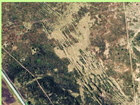
Udsnit af luftfoto (2006) fra Lundby hede. Man ser tydeligt et lille udsnit af de mange parallelle hjulspor over heden. Læg mærke til den moderne vej. Gå selv på opdagelse i luftfotos af landskabet.

I begyndelsen af 1900-tallet skete husmands-udstyknings også