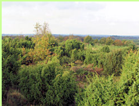
Den dag i dag er der langt mellem gårdene i Vendsyssels sandede bakker i Jyske Ås. Heder og skov veksler med lommer af opdyrket jord med en enkelt gård.

Tilgængeligheden af vinterfoder - hø fra engene – og en deraf muliggjort opsamling af gødning til markerne - var meget afgørende for placeringen. Driften med vinteropstaldning blev først udviklet i jernalderen, da man fik jernredskaber egnede til at slå den nødvendige mængde hø. Før den tid måtte husdyrene klare sig som de bedst kunne i skov og på overdrev. Ofte ses landsbyerne placeret på grænsen mellem et højere plateau og