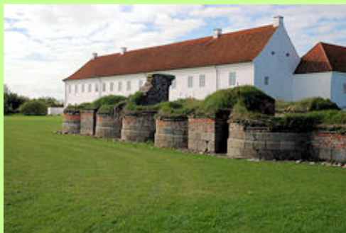
Vitskøl kloster syd for Ranum er et godt eksempel på kirken som magtfaktor i middelalderen. Ruinerne af klosterkirken er rester af en kolossal romansk basilika, oprindeligt planlagt til at blive Danmarks største kirke. En brand forpurrede dog planerne, men kirken har alligevel været imponerende. Koromgangen med de mange apsider (billedet) er enestående i Europa. Den er bygget for penge fra klosterets salg af øen Læsø.