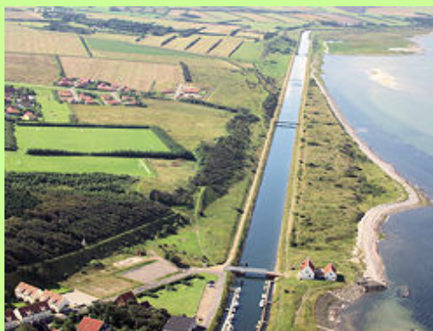
Frederik VII's kanal er et enestående kulturmiljø. Kanalen blev overflødiggjort, da det blev muligt med maskiner at friholde en sejlrende gennem Løgstør Grunde.