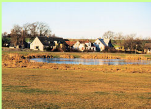
Voldsted er en af landets få intakte fortelandsbyer, med en stor ubebygget fælled med gadekær midt i landsbyen. Gårdene ligger i en kreds omkring fortens.