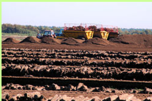
I Lille Vildmose findes spor af udnyttelse af