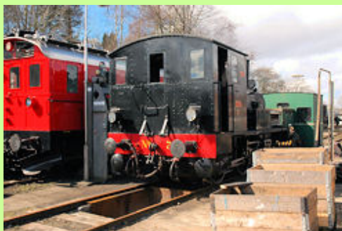
Mange jernbanelinier især fra det nordjyske privatbanenet er i dag forsvundet. Enkelte er bevaret som regionale cykelstier, f.eks. Nibe - Hvalsund og Aalborg - Hadsund stien. Andre er bevaret som veteranbaner, f.eks. Mariager - Handest.