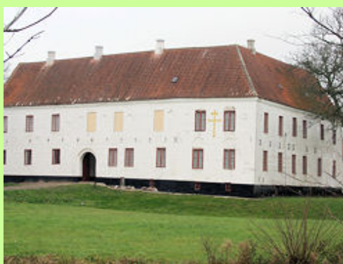
Den tidligere hovedgård Odden ved Mygdal er et godt eksempel på en nordjysk herregård. Gården er oprindeligt anlagt på et middelalderligt voldsted, omgivet af grave, vandløb og sumpe. Den ældste af de to nuværende bygninger er bygget omkring 1520. Odden rummer i dag en stor samling af maleren J. F. Villumsens værker.