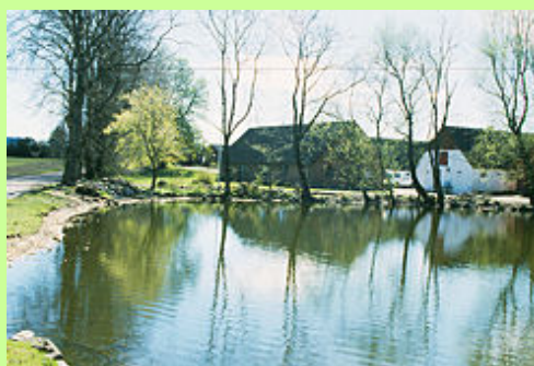
Landsbyens toft rummede ofte byens gadekær. Gadekæret har i århundreder været en vigtig del af landsbyens liv. Her blev vandet husdyr og vasket redskaber. Smeden afkølede vogringe og kar og tønder blev lagt i vand for at tætnes. Og ikke mindst var det landsbyens branddam. Måske har adgangen til vand oprindeligt udløst landsbyens placering. Her ses det velbevarede gadekær i Axelsterp.