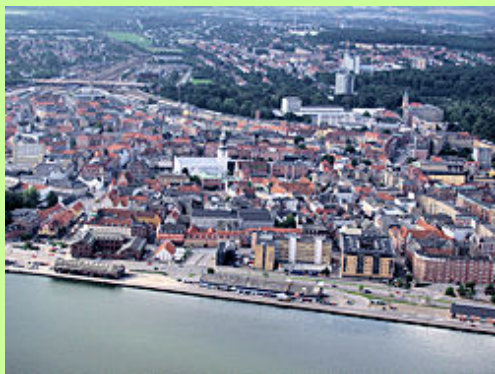
Den centrale del af købstaden Aalborg med Budolfi Kirke, set mod syd. Til venstre anes voldanlægget omkring Aalborg Slot nær havnen. Byen fik købstadsrettigheder allerede i 1342, men har aner tilbage i vikingetiden. Den første beboelse er sket på en øst -vest gående sandbanke, ca. hvor Algade ved Budolfi går i dag.