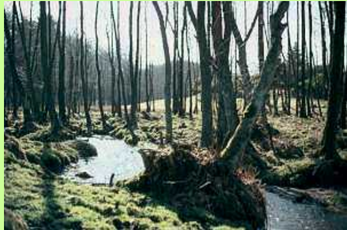
Ellesump langs Nymølle bæk

Selve Nymølle bæk er typeeksempel på et vandløbssystems fineste grene: "Øvre bæk". Faldet er godt, strømmen frisk og bunden mange steder med sten og grus. Det rene, grundvandsfødte vandløb rummer en rig fauna af vandløbsdyr, som forurening, regulering og hårdhændet vedligeholdelse har udryddet mange andre steder. Ved at pille lidt i breddens vegetation eller vende et par sten, kan man finde bækkens mindste beboere: Hurtigtvømmende strømlinede døgnfluelarver, vårflyelarverne med deres huse af sand, småsten eller pinde og de langsomtkravlende sløvingelarver, som hører til de mere sjældne af bækkens dyr.