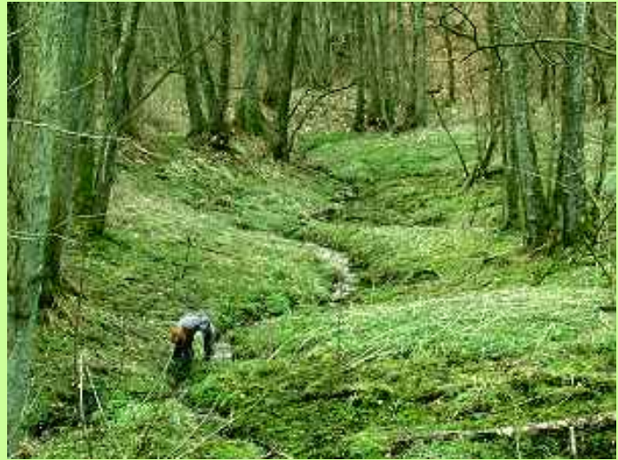
Flerstammede Rød-El langs kilde

med fødderne i vand. Rød-El danner særlige rodknolde, der indeholder en svamp, som kan optage kvælstof fra luften. Samme mekanisme ses hos ærteblomstfamilien, der på denne måde forsyner sig med næring.